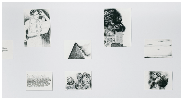
1. Liminal Death , 2023. Courtesy of the Artist 2. Absence in Substantia: Density [detail], 2023. Photo: Christian Capurro. Courtesy of the Artist 3. Subtext - after Kawara's Title, 1965 , 2019. Installation view at Van Every/Smith Galleries of Davidson College, NC, USA, 2019. Photo: Gordon Ramsey. Courtesy of the Artist 4. Some Memory Unfurls [detail], 2024. Courtesy of BAIK ART 5. Memory is Frail (and Truth Brittle) [detail], 2019. Courtesy of the Artist

ティンティン・ウリア (1972年、デンパサール・インドネシア生まれ) オーストラリア、イギリス、スウェーデン在住のインドネシア人アーティスト。地政学的、社会的な境界をインターフェイス (接点) と捉え、市民権、戦争、国家機密など、国境に関連するテーマを扱う。民族的なマイノリティである中国系バリ人として育った自身の生い立ちや、移住の経験と、グローバルゼーションやグローバルな政治を織り交ぜながら、多領域にわたるインスタレーション作品を発表する。研究者としては近年、1965–66年のインドネシア大虐殺に関連する機密解除された米国文書の他、社会政治的変革における美的オブジェクトの役割に関する研究を進めている。